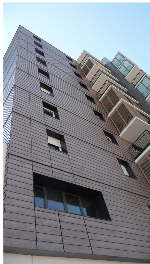
CONCEPTION: J.F. BENOIT ARCHITECTURE

LA MISE EN ŒUVRE DOIT ÊTRE CONFORME AUX AVIS TECHNIQUES PRODUITS/SYSTÈMES, A NOTRE BROCHURE D'INFORMATIONS TECHNIQUES EXTERIOR ET AUX RÉGLEMENTATIONS – NORMES – ARRÊTÉS-INSTRUCTIONS TECHNIQUES – CAHIERS TECHNIQUES CSTB EN VIGUEURS